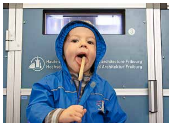
Max aus Marly freut sich über das süsse Experiment.