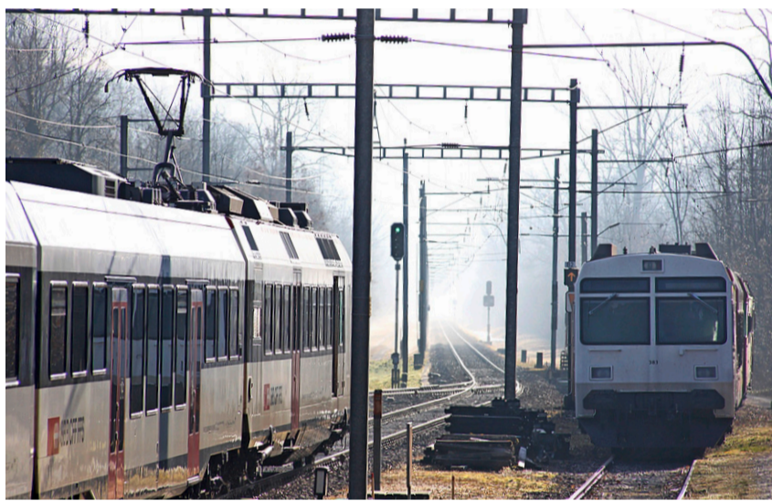
Beim Bahnhof Sugiez wird der Zugverkehr nächstes Jahr während fünf Monaten eingestellt.