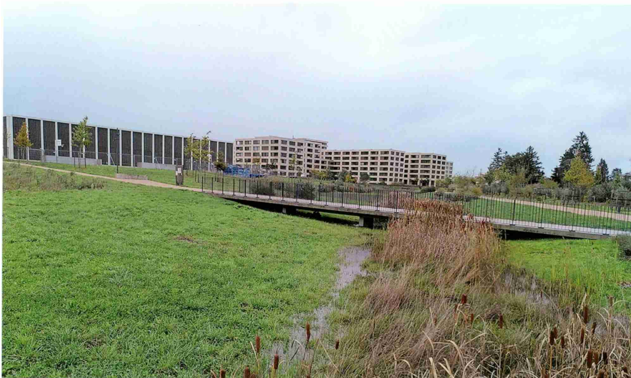
Bepflanzte Versickerungsmulde, Belle-Terre, Thônex (GE).