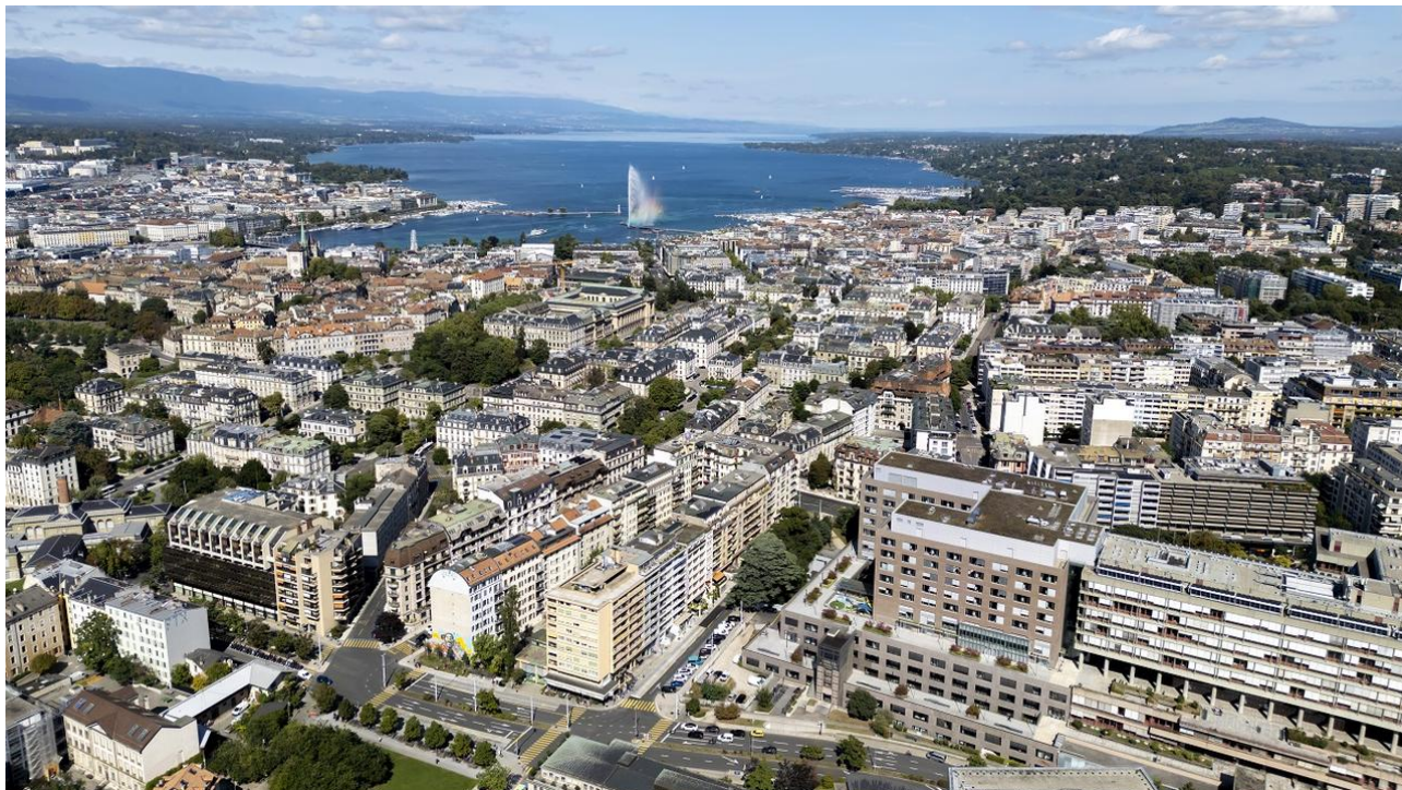
Crise du logement : le bilan mitigé d'une loi genevoise qui vise à transformer plus facilement les bureaux en logements / La Matinale / 1 min. / aujourd'hui à 06:22