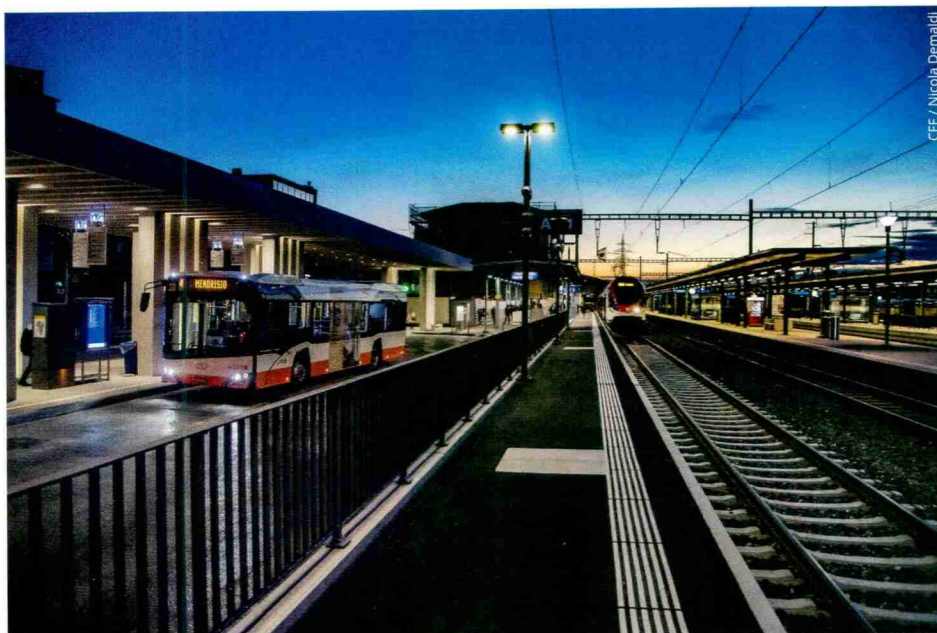
La gare de Mendrisio Binario 1 au Tessin.

► Lire l'article complet dans SE/RTS 9, page 12